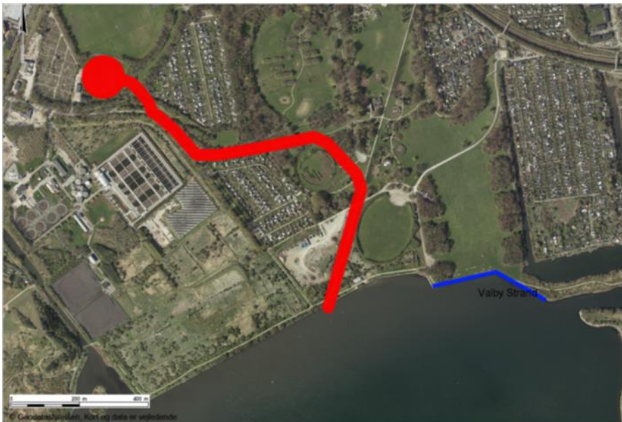
Figur 1. Den røde streg viser forslaget fra den oprindelige skybruds-konkretisering. Bredden på den røde streg angiver cirka bredden på skybrudsløsningen.

udvidelsen af tunnelprojektet svarer til de estimerede omkostninger for overfladeprojektet. Der bliver således ikke forøgede omkostninger som følge af skiftet i løsningstype. Det skal bemærkes, at beregningen af omkostningerne for begge projekter er foretaget i den indledende projektfase, hvorfor der kan forekomme mindre variationer i omkostningerne i forhold til fremtidige beregninger. Der mangler flere forundersøgelser før den endelige beslutning kan foretages. Medfører forundersøgelserne, at prisen bliver væsentlig dyrere, vil et nyt forslag blive udarbejdet.