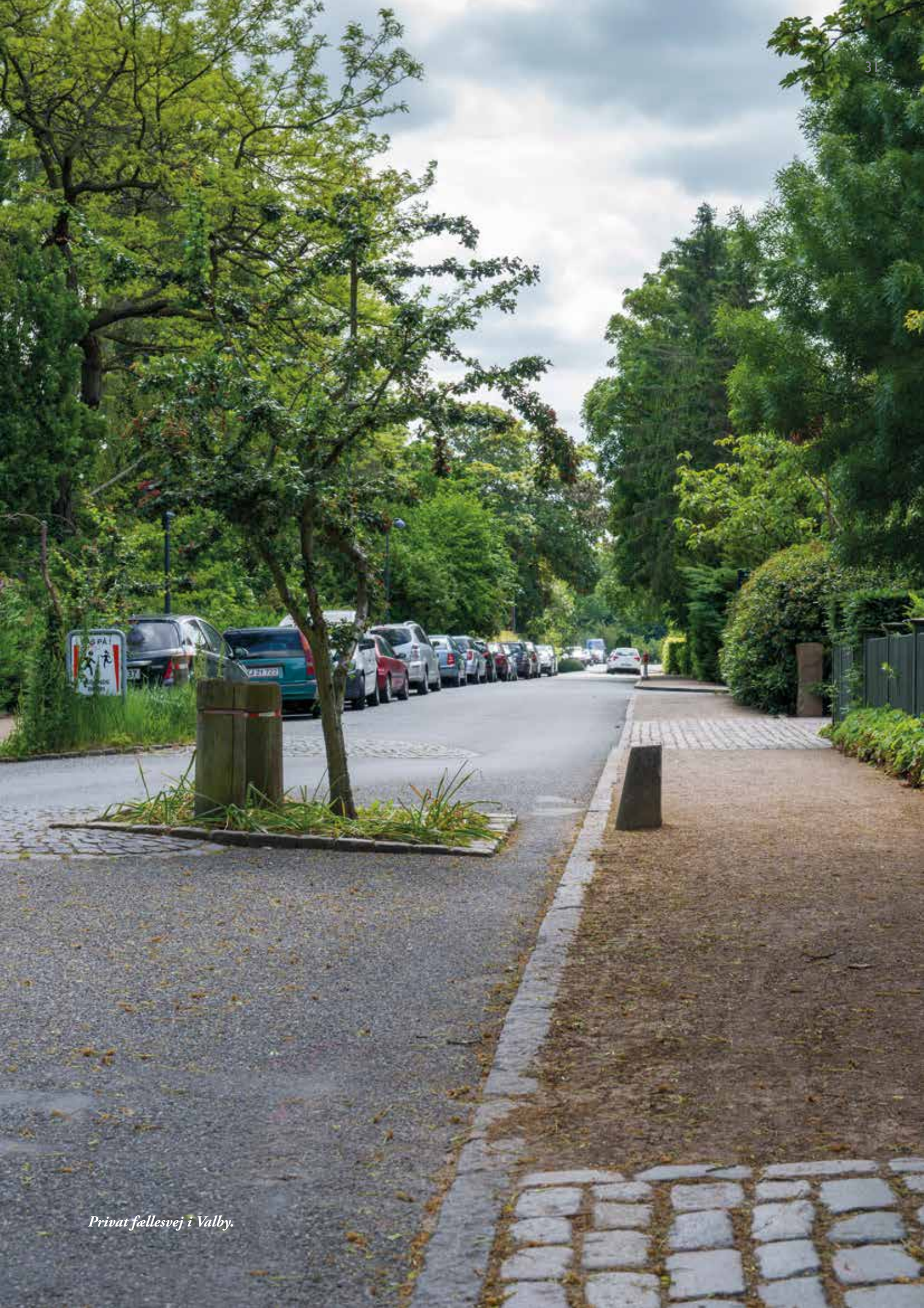
Privat fællesvej i Valby.