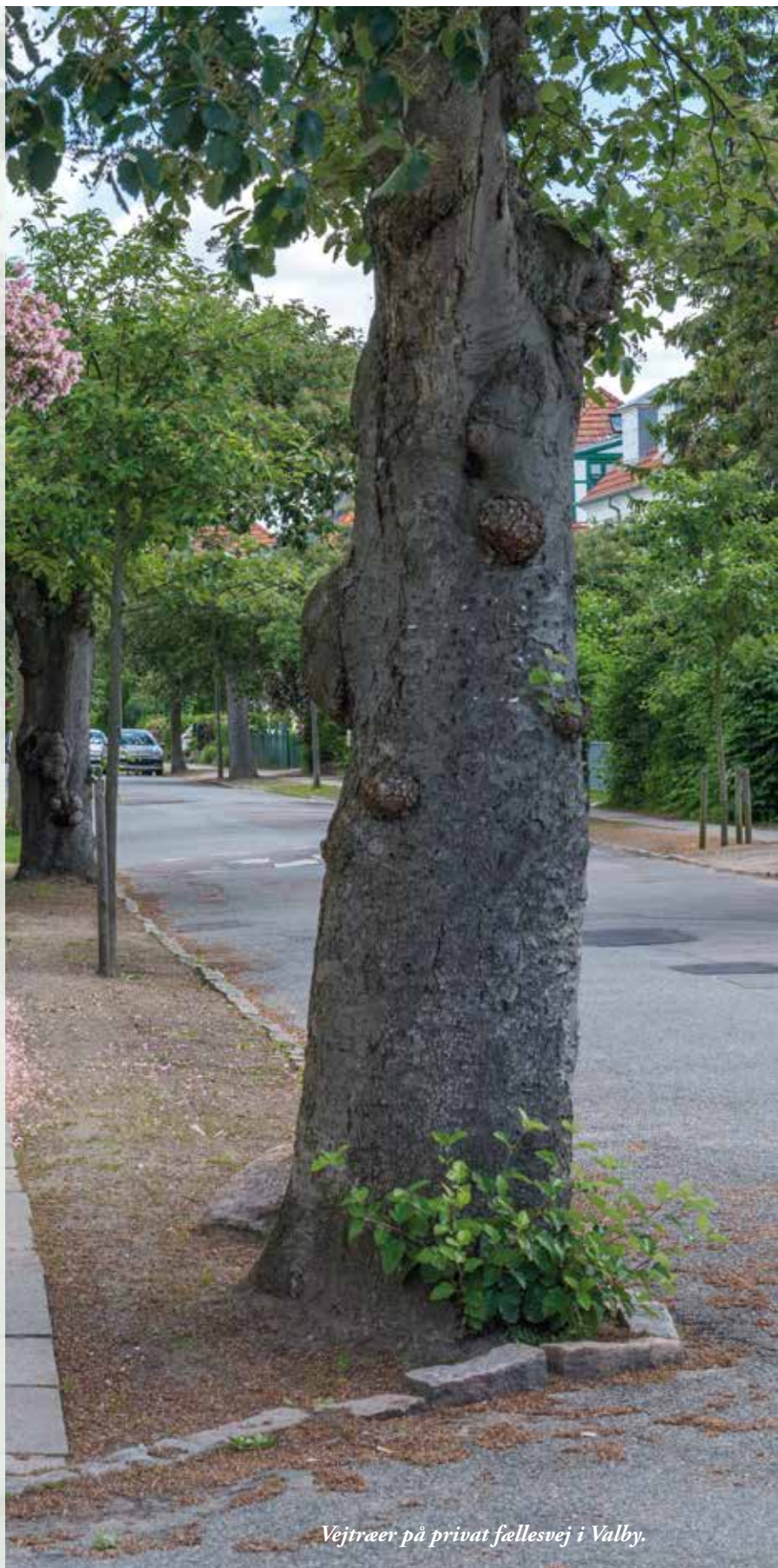
Vejtræer på privat fællesvej i Valby.

Vær opmærksomme på, at vejtræet får nok åben jordoverflade og eventuelt et rodvenligt bærelag. Regn med, at der skal graves ca. 10 kubikmeter jord op, som skal erstattes af god plantejord. Husk at sikre jer, at der er ordentligt drænet omkring hullet, så træet ikke drukner. Desuden skal man sikre sig, at træet får vand nok i tørkeperioder. Der skal ydermere være en kronefrihøjde på 2,8 meter over fortov og cykelsti og 4,5 meter over vejen.