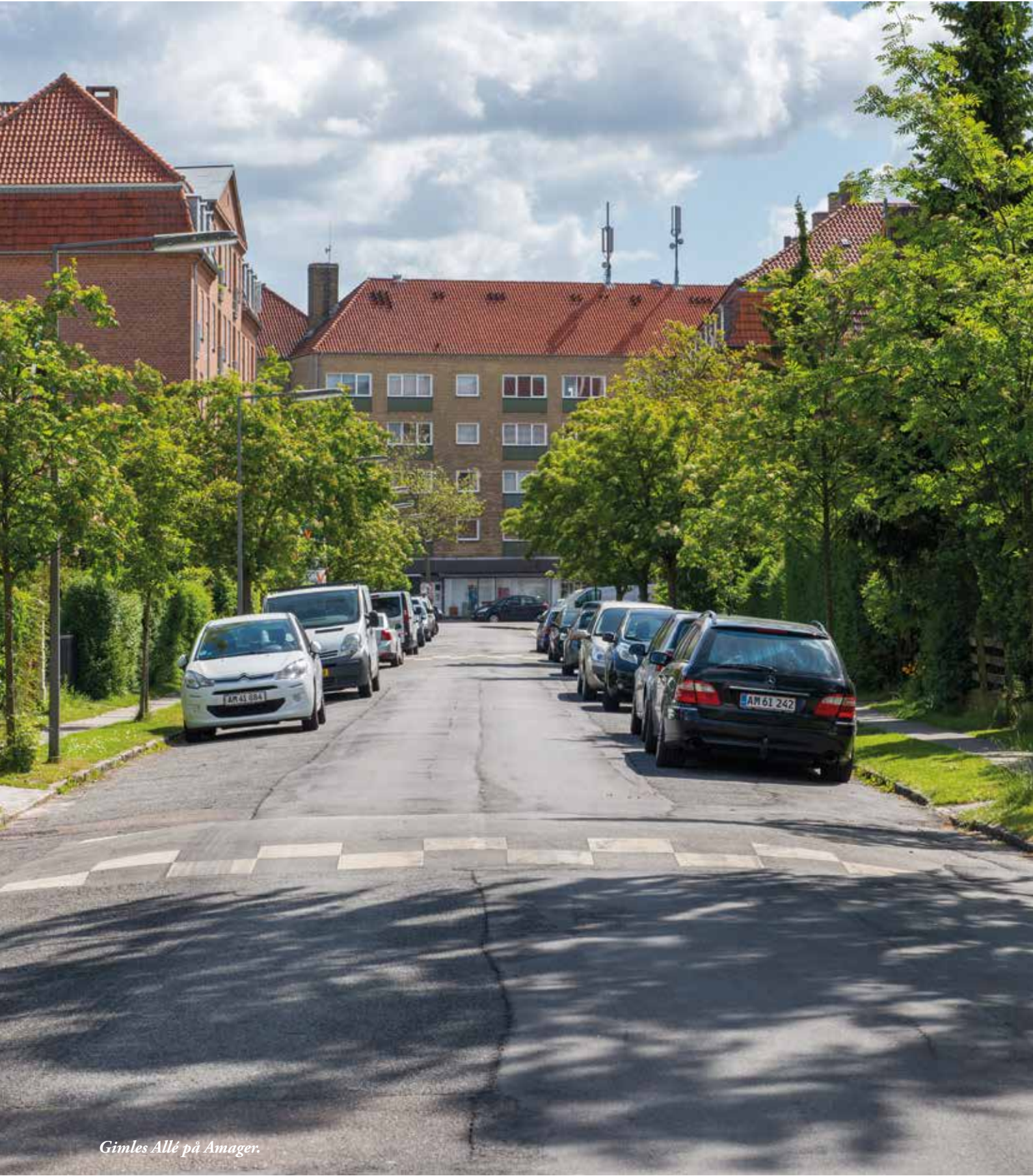
Gimles Allé på Amager.