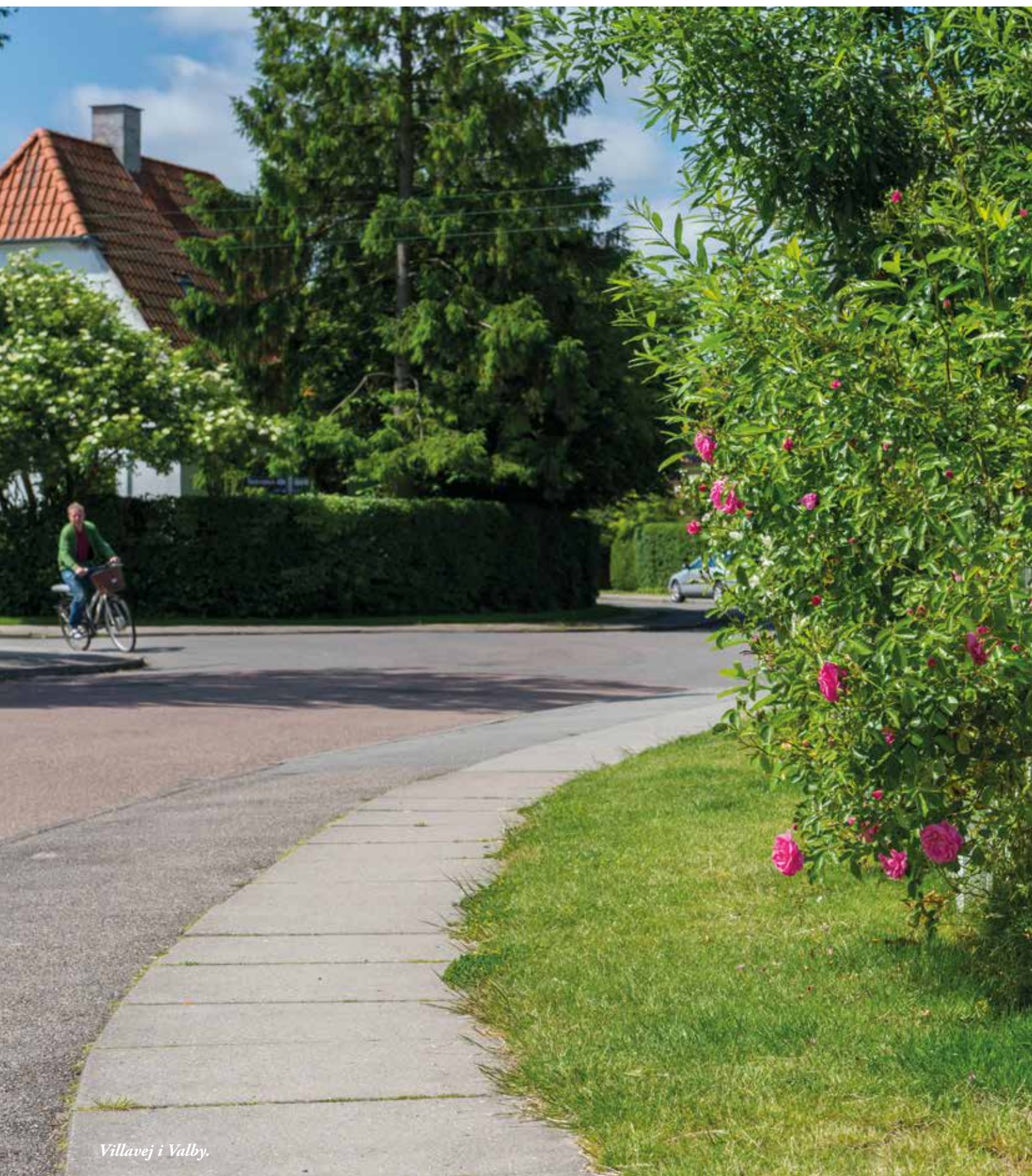
Villavej i Valby.