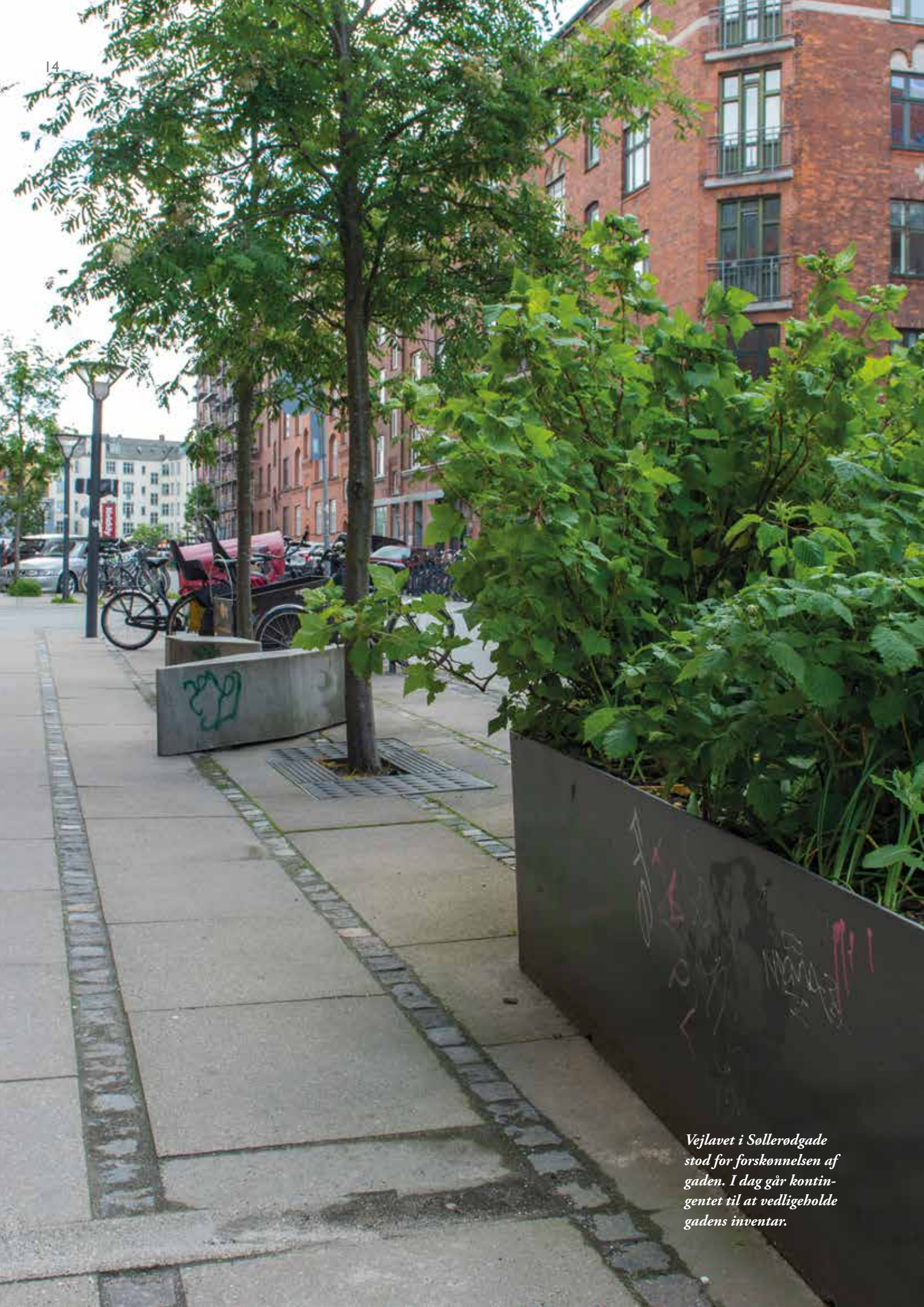
Vejlavet i Søllerødgade stod for forskønnelsen af gaden. I dag går kontingentet til at vedligeholde gadens inventar.