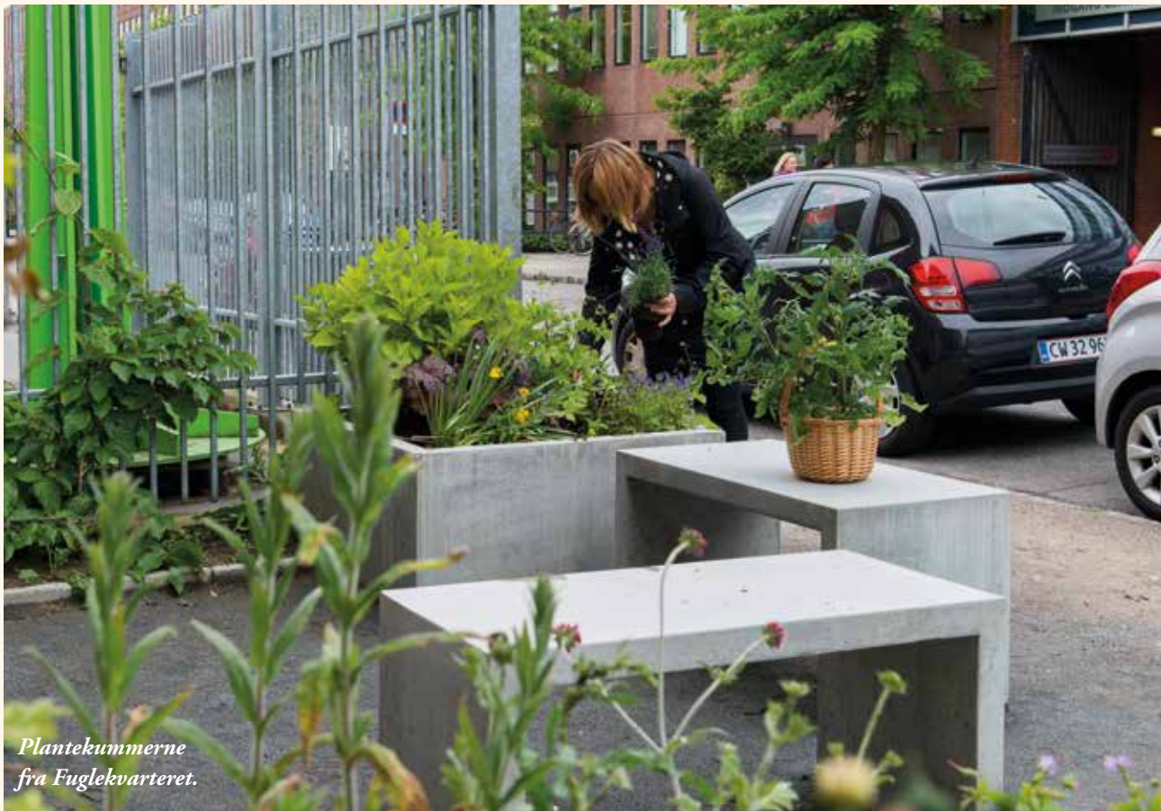
Plantekummerne fra Fuglekvarteret.

Udover møblerne har Områdefornyelse udviklet plantepakker med sol- eller skyggeelskende planter, der kan bestilles alt efter kummernes placering. Ved Bo- og Dagtilbuddet på Musvågevej har Den Grønne Oase betydet meget, da det både har givet beboerne noget at se og sidde på, men også forhindrer parkering på fortovet ved indgangen.