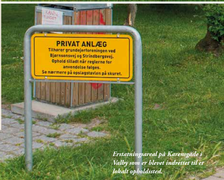
Erstatningsareal på Karengade i Valby som er blevet indrettet til et lokalt opholdssted.