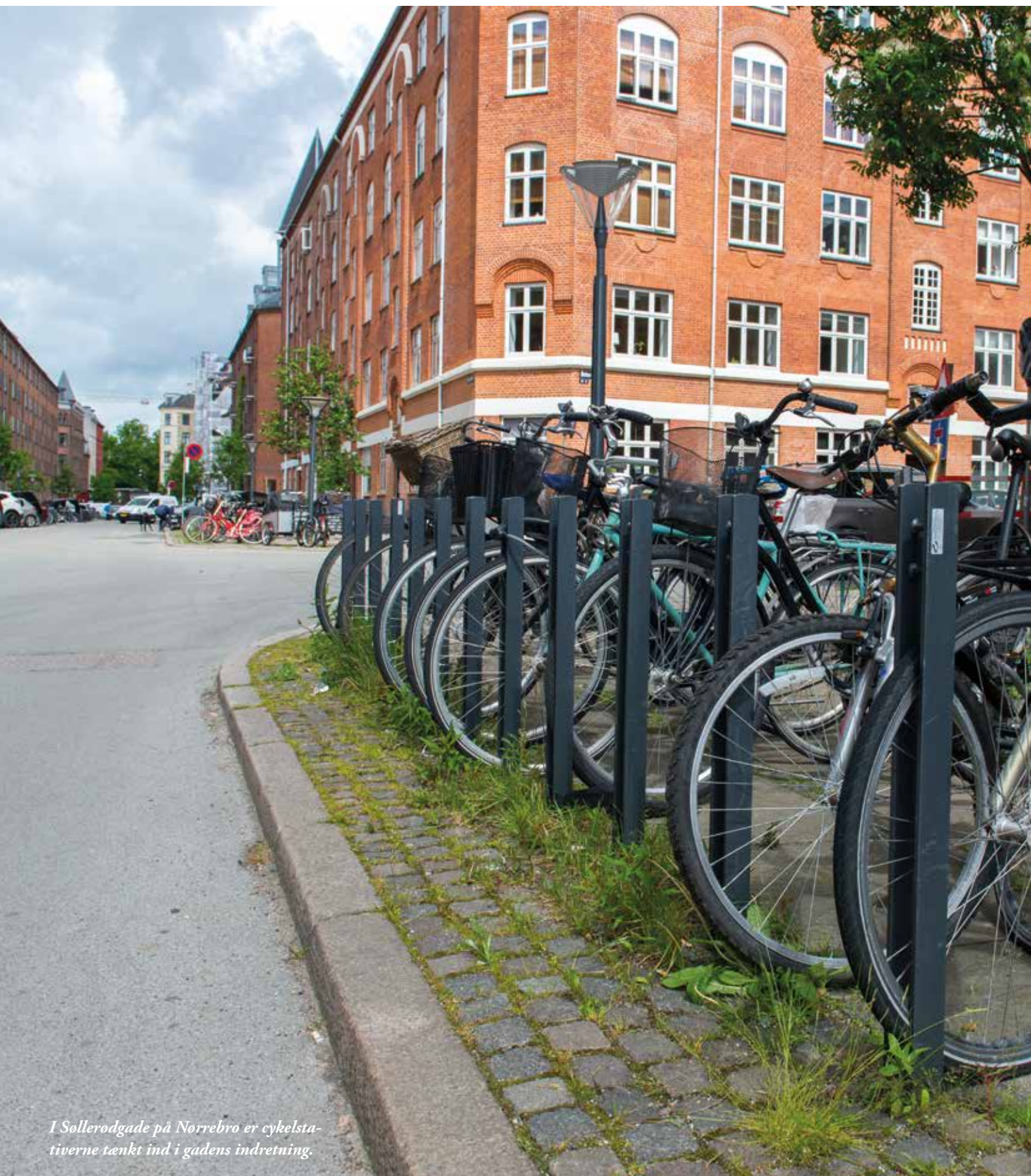
I Sollerodgade på Nørrebro er cykelstativene tænkt ind i gadens indretning.