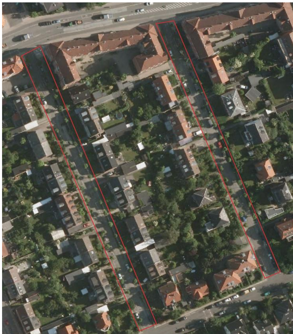
Kongedybs Allé og Provstens Allé: