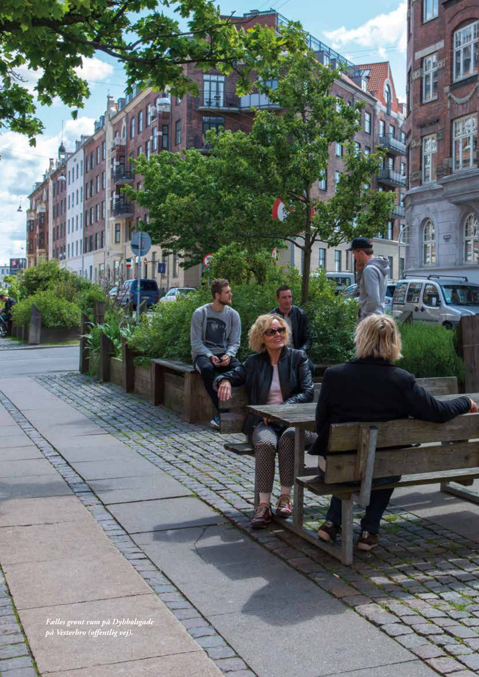
Felles grønt rum på Dybbølsgade på Vesterbro (offentlig vej).