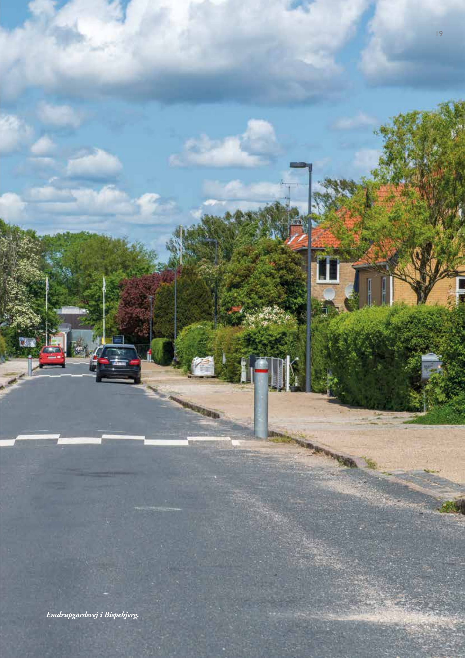
Emdrupgårdsvej i Bispebjerg.