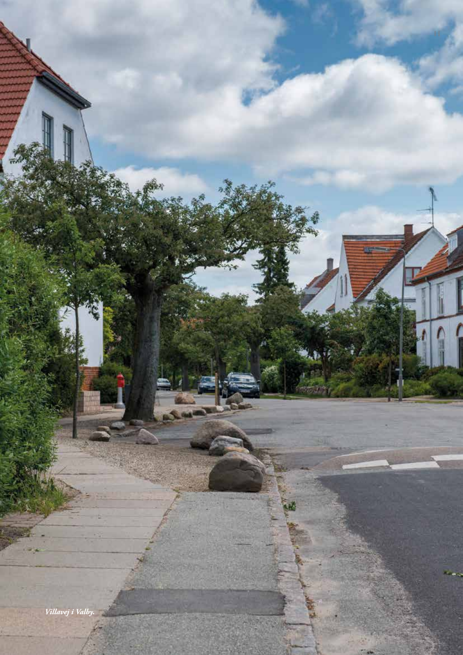
Villavej i Valby.