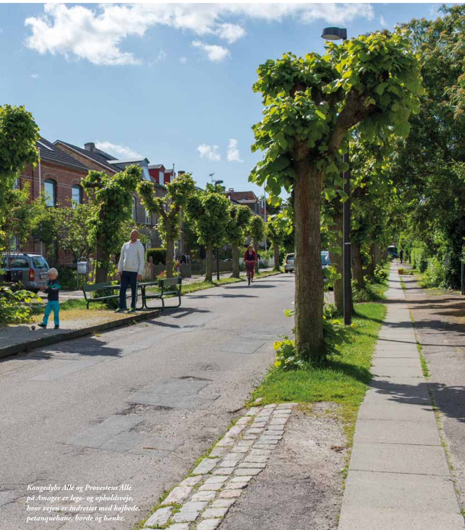
Kongedybs Allé og Prøvestens Allé på Amager er lege- og opholdsveje, hvor vejen er indrettet med højbede, petanquebane, borde og bænke.