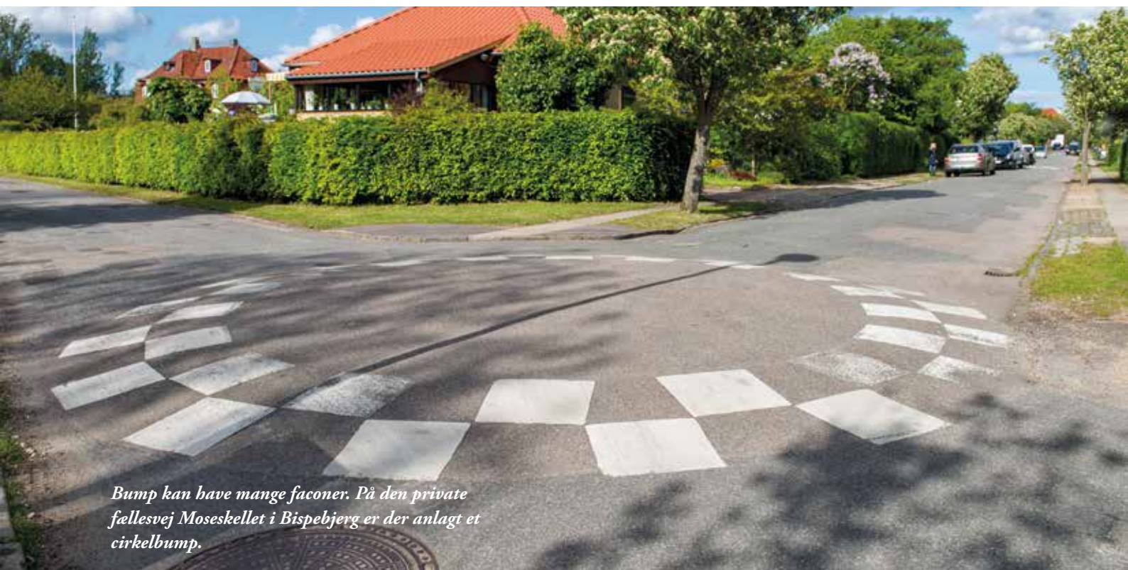
Bump kan have mange faconer. På den private fællesvej Moseskellet i Bispebjerg er der anlagt et cirkelbump.