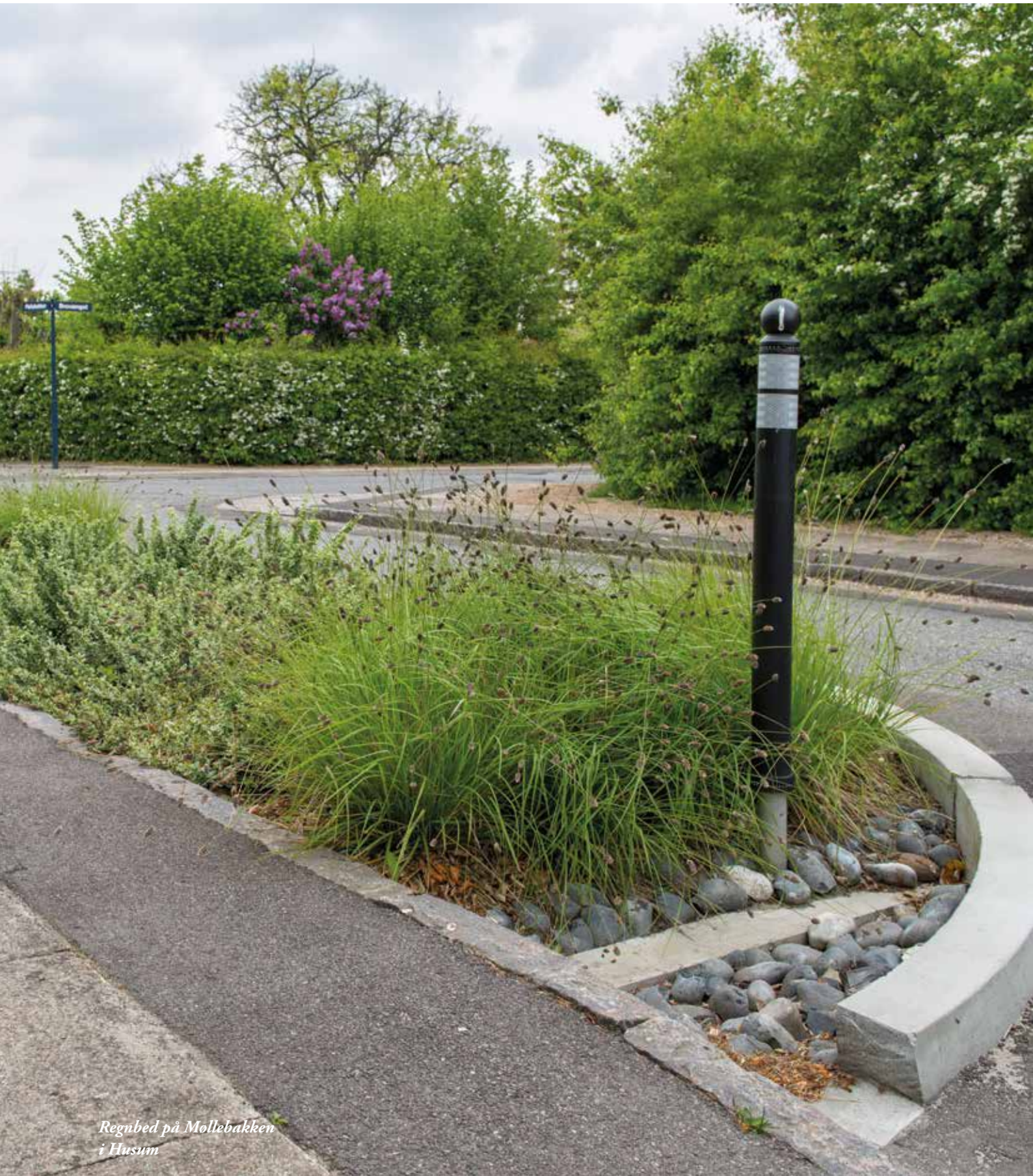
Regnbed på Mollebakken i Husum