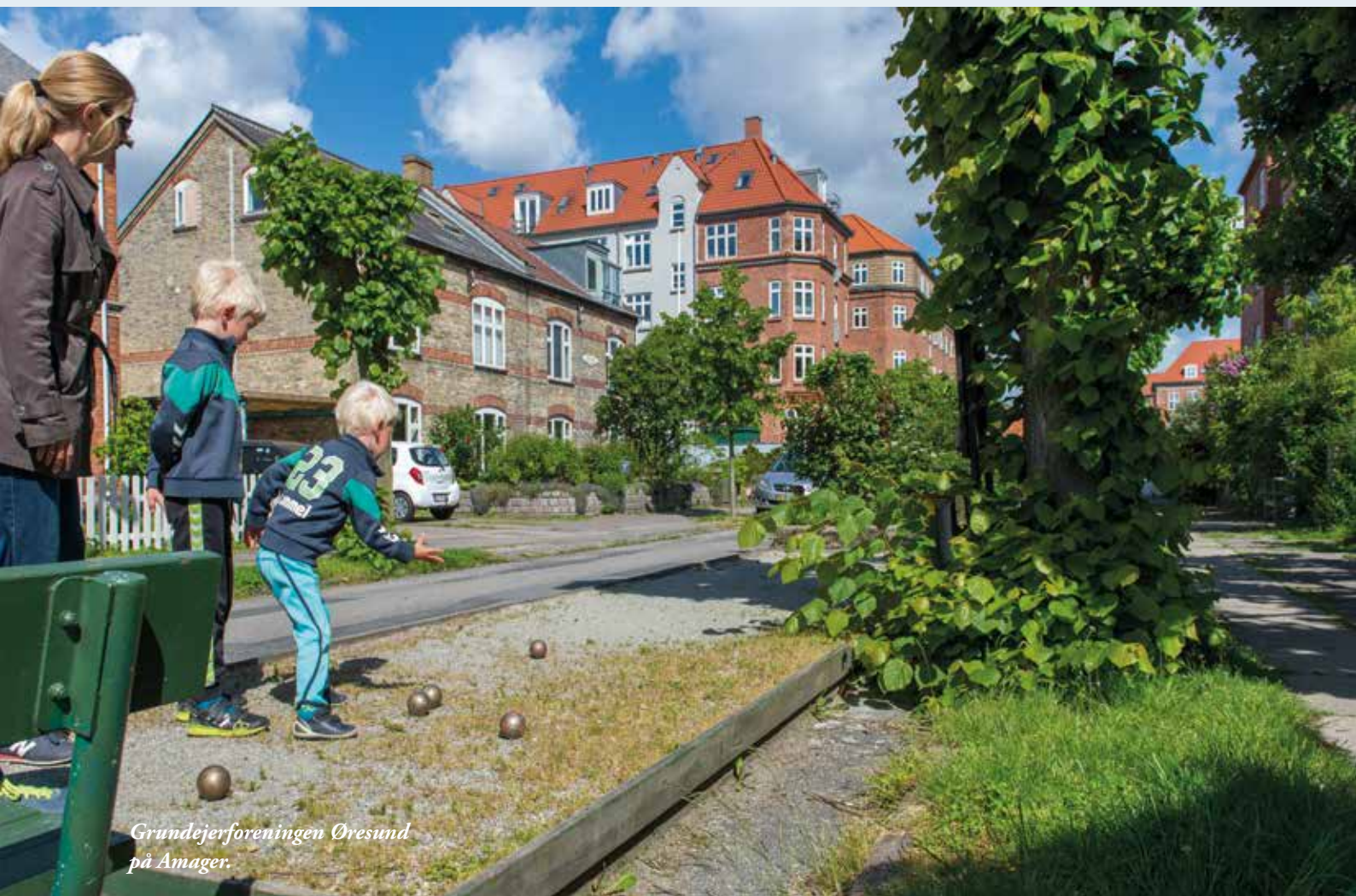
Grundejerforeningen Øresund på Amager.

I grundejerforening Øresund var der et ønske om at klimatilpasse vejene. Der blev nedsat en projektgruppe, som også indeholdt repræsentanter fra vejlavet. De inviterede alle grundejere til en fælles workshop, hvor de talte om, hvad der var vigtigt at overveje i forhold til projektet. Projektgruppen var rundt og stemme dørklokker hos alle beboere, hvilket var vigtigt for at få folk til at deltage i mødet. Den korte snak i gadedøren gav mulighed for at beskrive projektet og gjorde beboerne nysgerrige i at deltage i workshoppen. Til workshoppen talte de om de fordele og problemstillinger, som kan opstå i et klimatilpasningsprojekt på vejen. Kunne de eksempelvis få flere spændende planter ved at lave regnbuede? Hvad kunne projektet komme til at betyde for parkering på vejen? Sammen fandt de frem til, hvilke muligheder og begrænsninger de så i projektet, og det gav et godt grundlag for, at projektgruppen kunne lave en ansøgning.