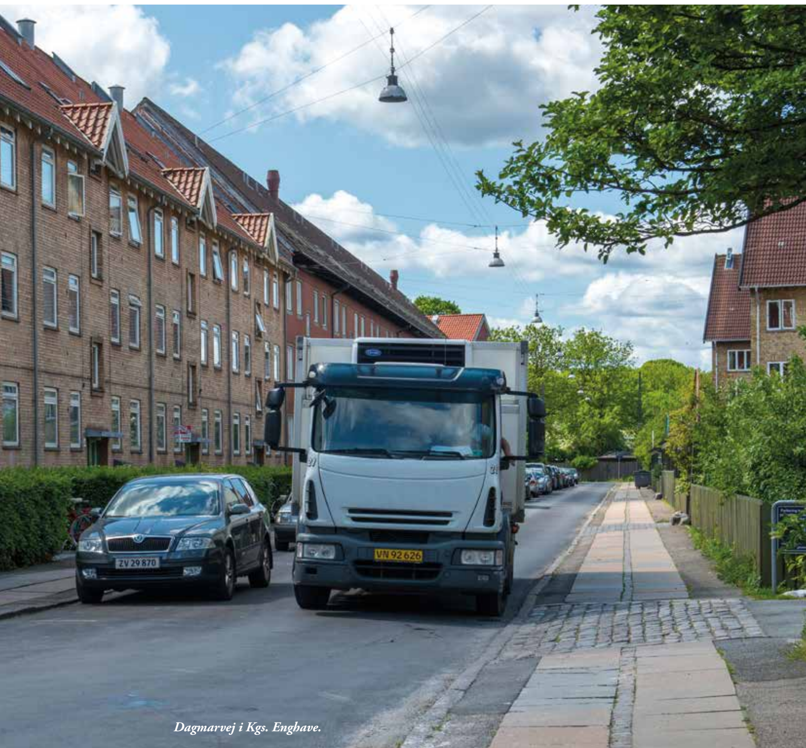
Dagmarvej i Kgs. Enghave.

dokumentere vejens stand inden et anlægsarbejde begynder. Dokumentation kan bagefter bruges til at kræve en eventuel udbedring af skader, der er sket i forbindelse med anlægsarbejdet. Det kan fx være et ødelagt fortov eller nedkørte kantstene og fortovshjørner.