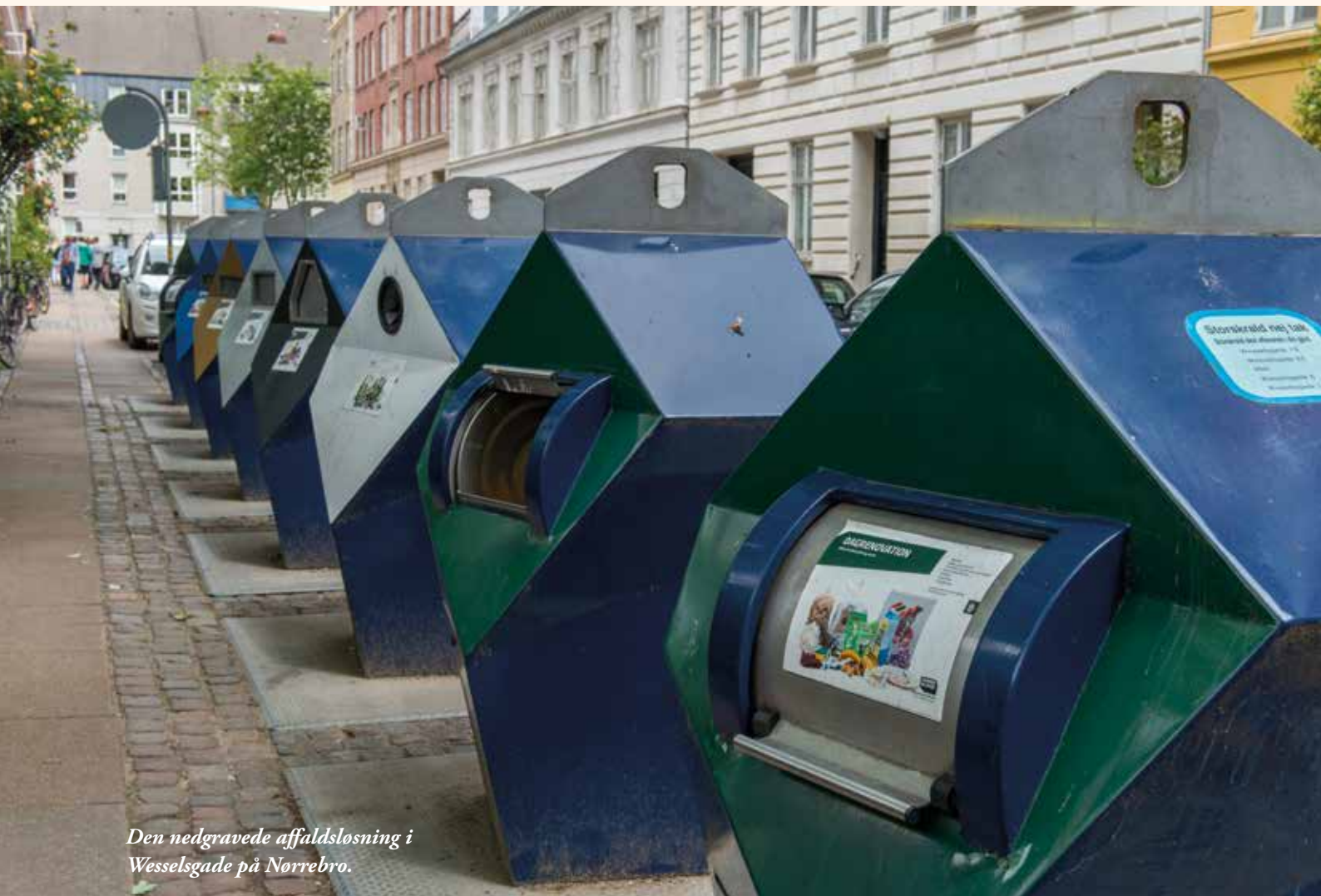
Den nedgravede affaldsløsning i Wesselsgade på Nørrebro.

Miljøstationen er 20 meter lang og dækker over otte nedgravede beholdere med indkast over jorden. Her kan beboerne sortere deres affald i dagrenovation, glas, pap, papir, metal og hård plast. Småt elektronik, storskrald og farligt affald bliver foreløbigt inde i gårdene. Miljøstationen fylder fire parkeringspladser, som er blevet genetableret et andet sted på gaden. Det kostede ca. 1,75 mio. eksklusiv moms at lave miljøstationen.