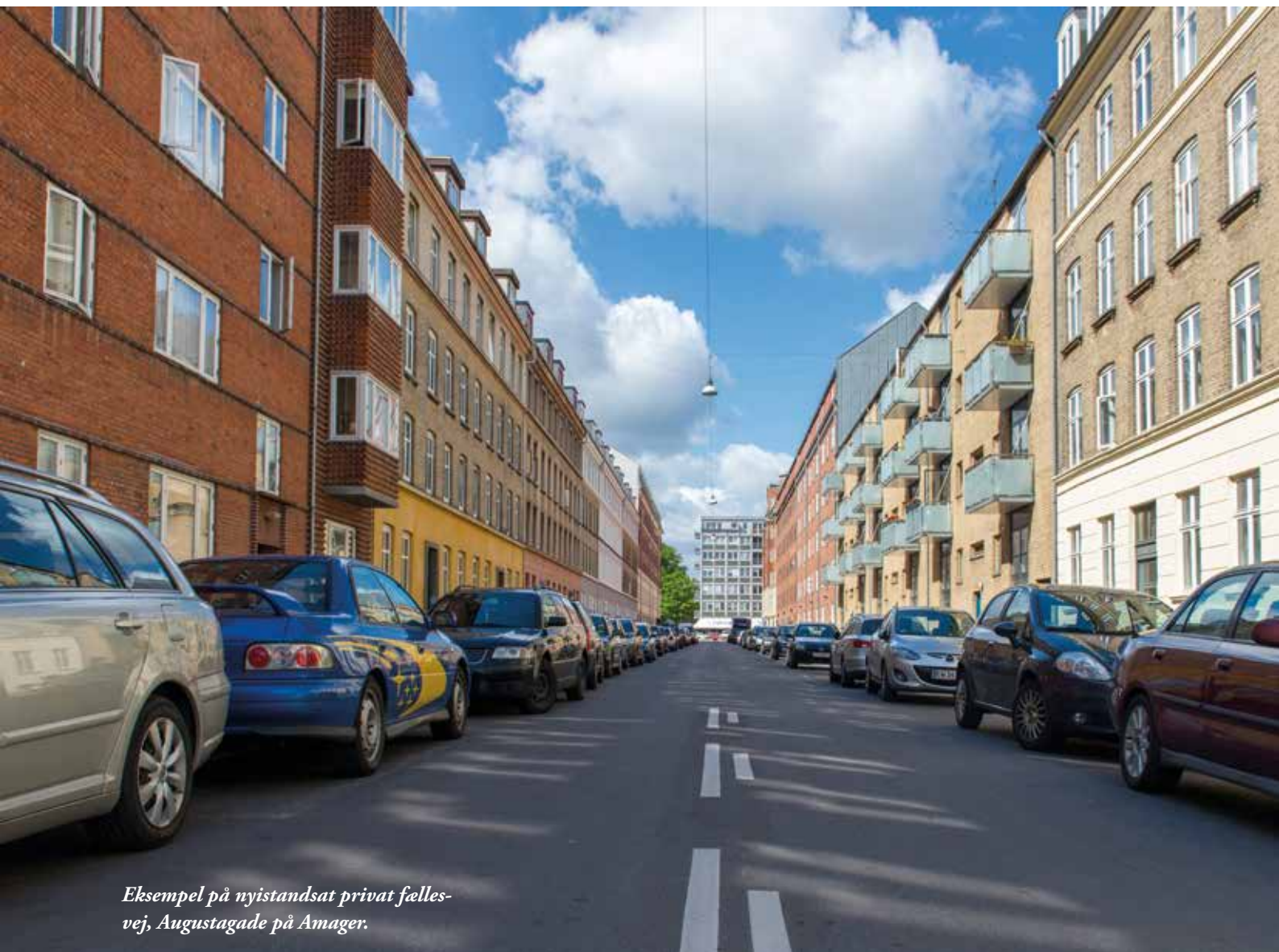
Eksempel på nyistandsat privat fællesvej, Augustagade på Amager.

Det er selvfølgelig også en mulighed at lade vejen forfalde, indtil der kommer et påbud, som alle grundejere skal betale til. Det er dog værd at undersøge, om løbende vedligehold ikke bedre kan betale sig for vejlavet, selv om der er gratister på vejen.