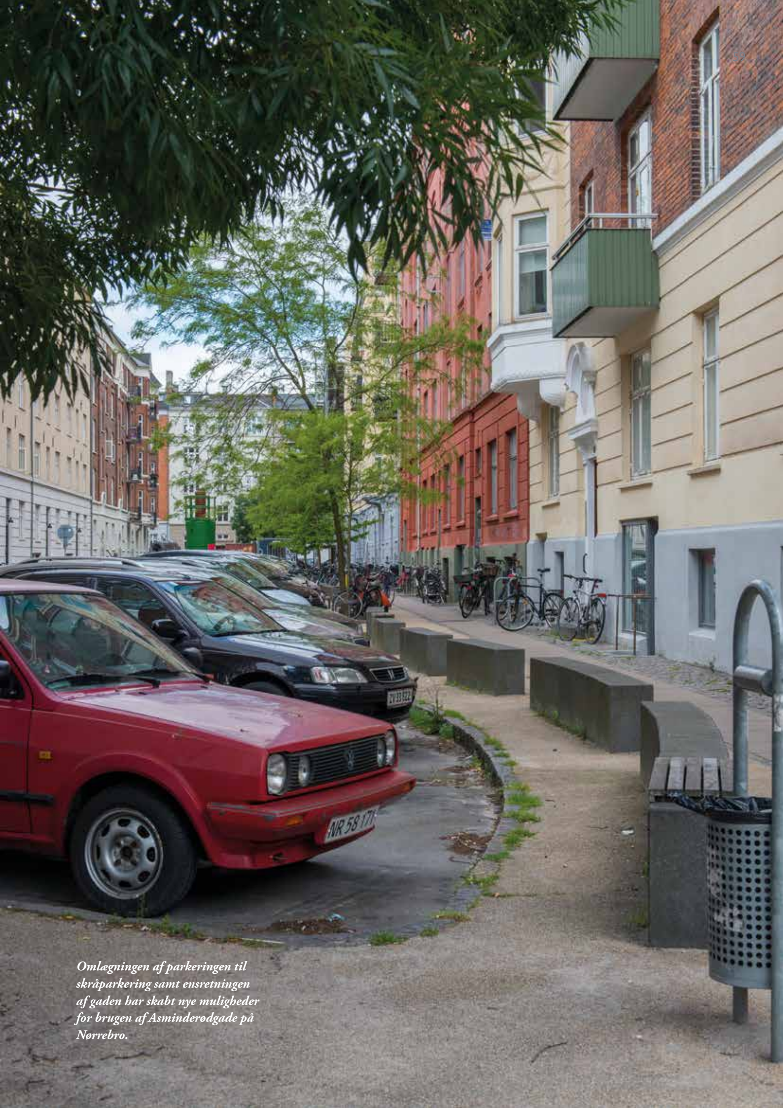
Omlægningen af parkeringen til skråparkering samt ensretningen af gaden har skabt nye muligheder for brugen af Asminderodgade på Nørrebro.