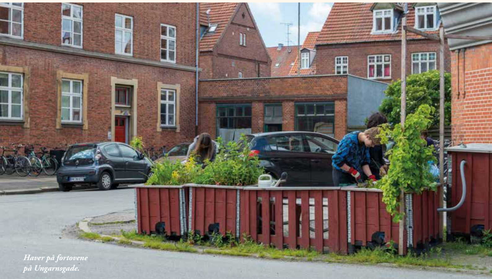
Haver på fortovene på Ungarnsgade.

At dyrke grønt kan handle om meget mere end at dyrke mad. Potter med blomster på fortovet, træer i vejkanten, klatreroser op ad bygningerne, en bæk i skyggen af et æbletræ er alle tiltag, der kan gøre gaden og gården mere grøn, tiltrækkende og levende. Og til et sted, hvor I kan slappe af og møde hinanden.